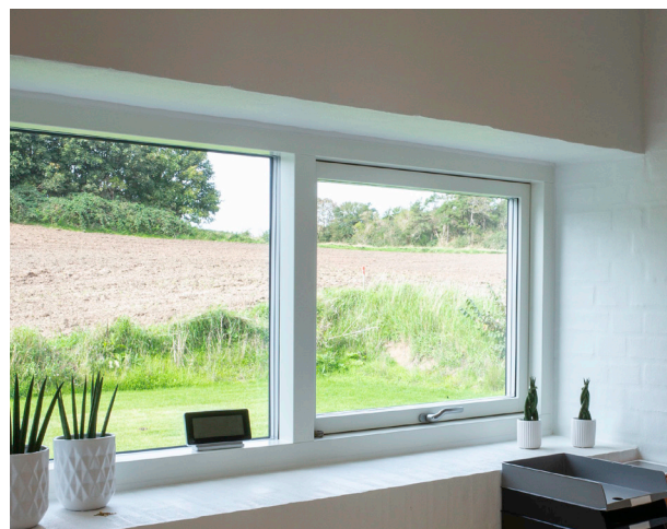
COTO 62 // TRÆ/ALU