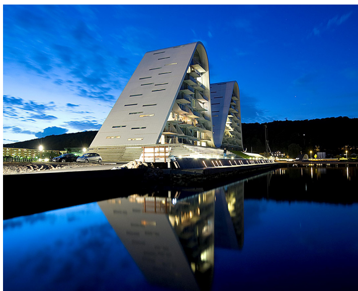
COTO 62 // TRÆ/ALU