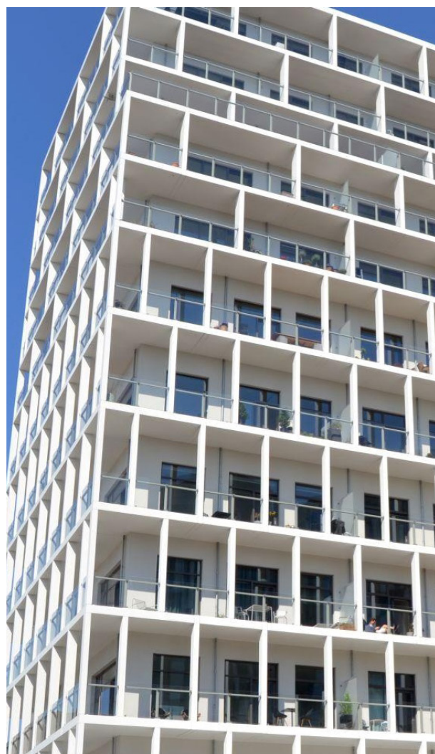
COTO 62 // TRÆ/ALU