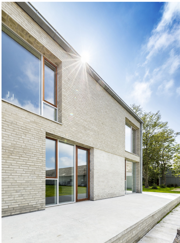
COTO 62 // TRÆ/ALU