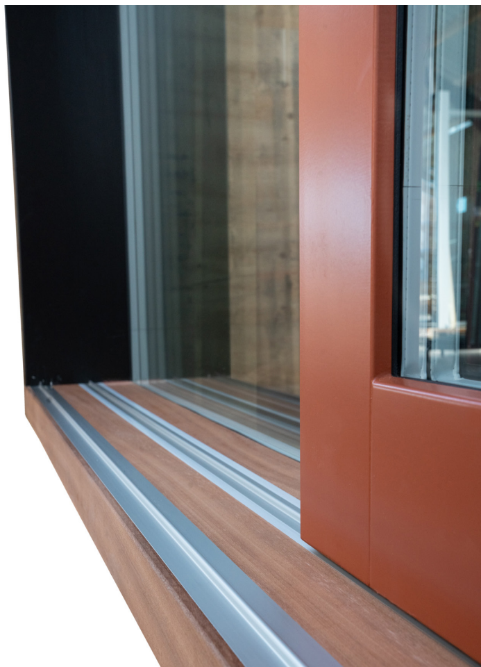
SKYDEDØR // 3-FLØJET