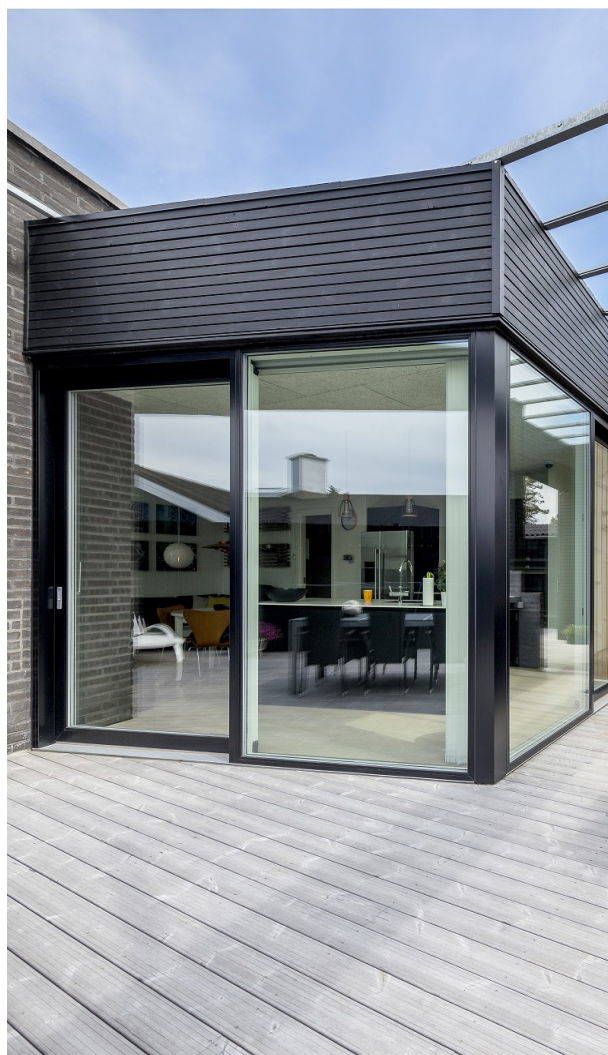
SKYDEDØR // TRÆ/ALU