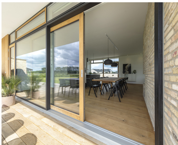
SKYDEDØR // EGETRÆ