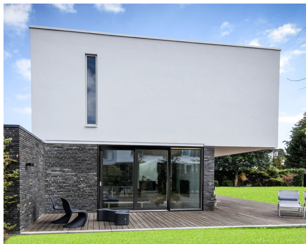
SKYDEDØR // TRÆ/ALU - 3-FLØJET